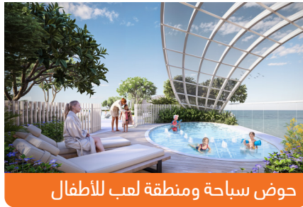
حوض سباحة ومنطقة لعب للأطفال