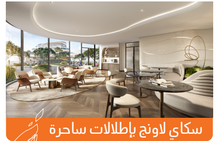
سكاي لاونج بإطلالات ساحرة