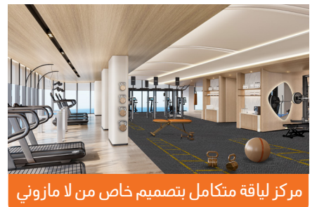
مركز لياقة متكامل بتصميم خاص من لا مازوني