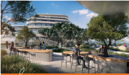
مساحة عمل مشتركة

خارج حدود ملاذك الخاص، يتكشف أمامك عالم من الترف الحصري. صُمم لكل من يسعى إلى التميز، حيث تعكس كل خدمة وميزة جوهر الحياة الراقية. من الزوايا الهادئة إلى المساحات الاجتماعية النابضة بالحياة، تم تصميم كل تفصيلة في لا مازوني لترتقي بأسلوب حياتك، وتقدم مزيجًا متناغمًا من الفخامة والراحة والرقي