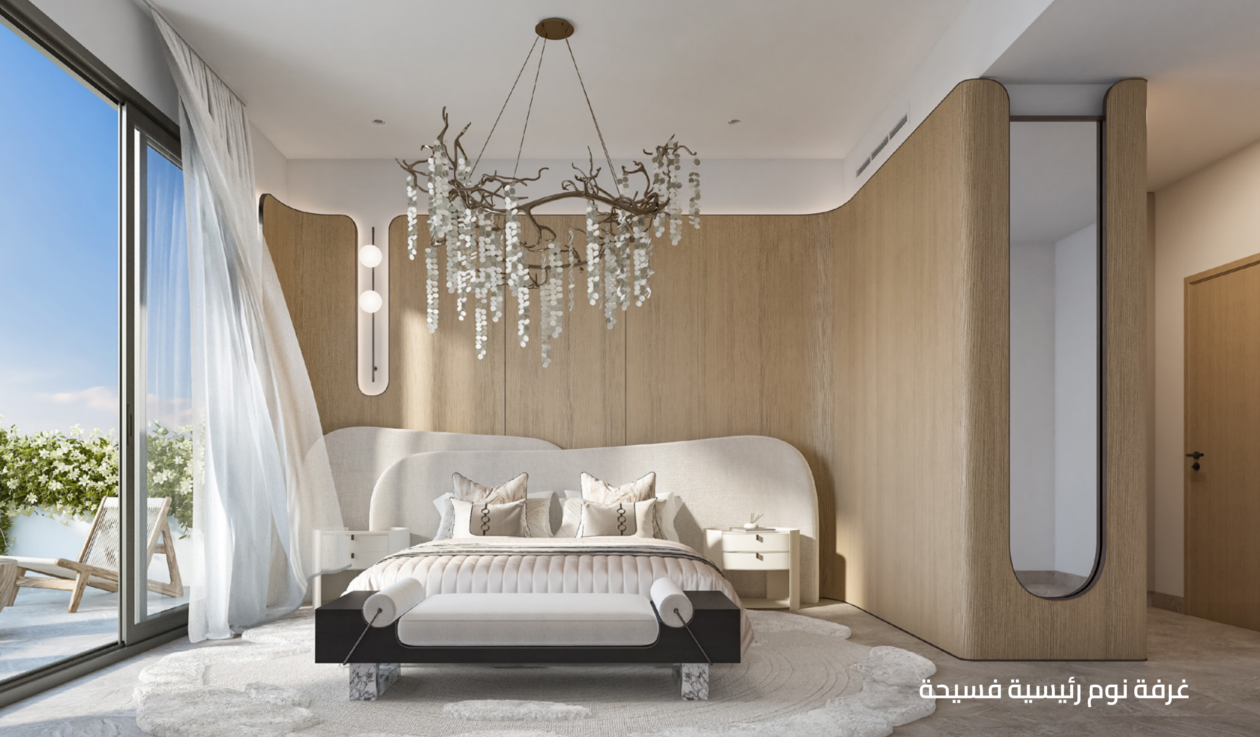
غرفة نوم رئيسية فسيحة