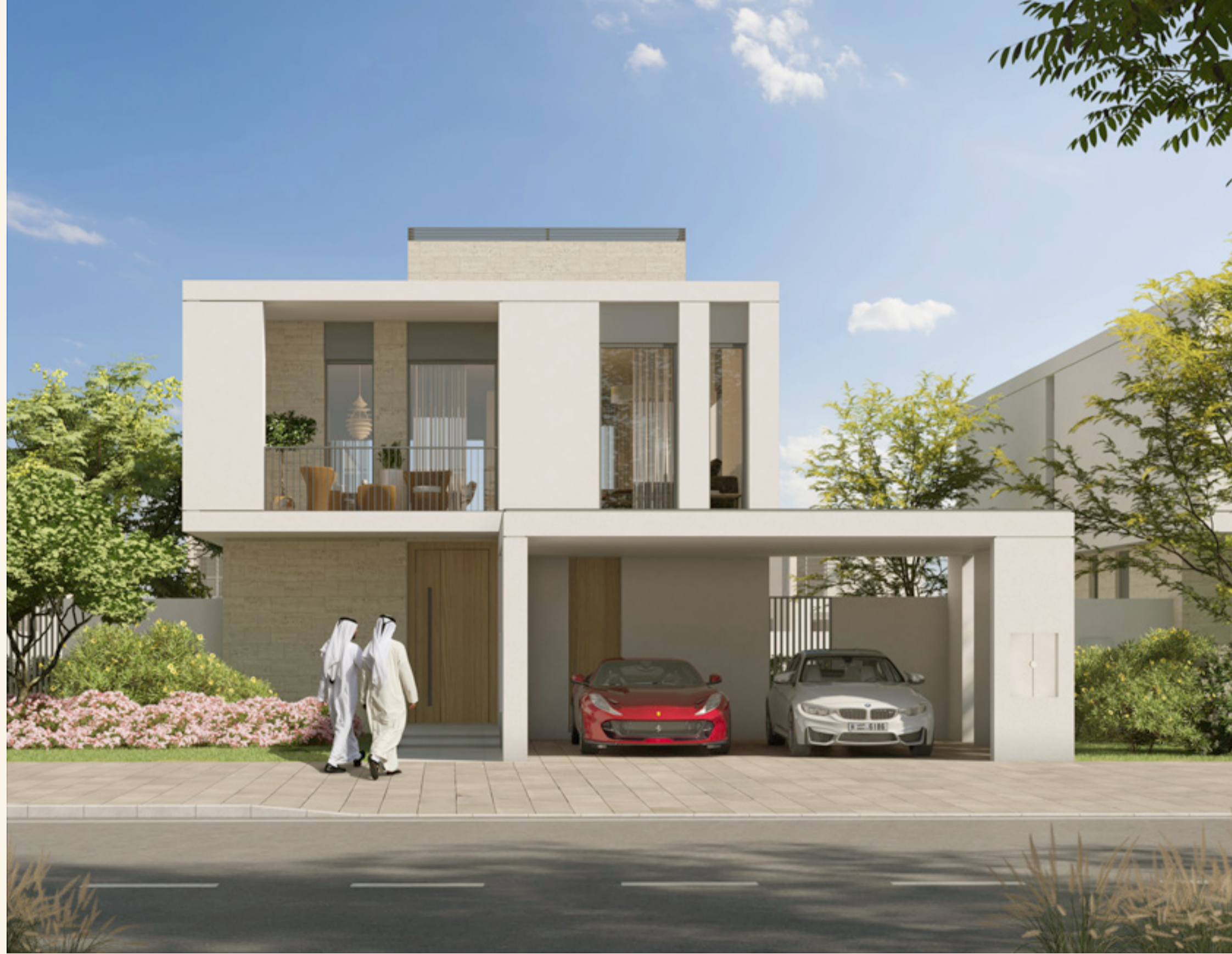
فيلا بثلاث غرف نوم