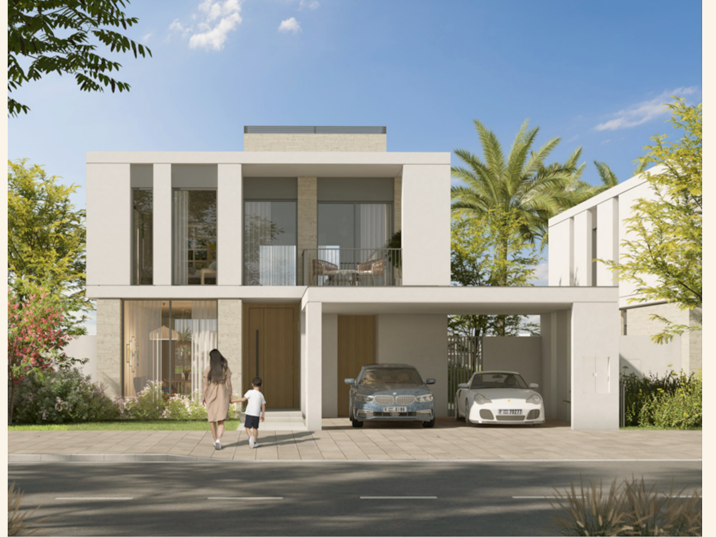
فيلا بأربع غرف نوم